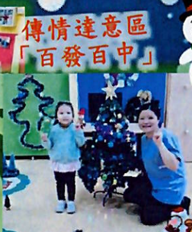
傳情達意區 「百發百中」