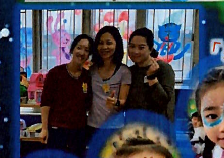
戲劇區 「彩繪扮靚小天地」