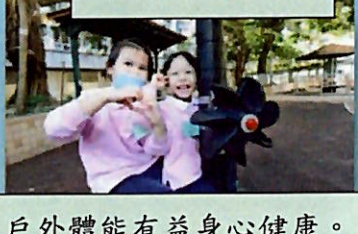
戶外體能有益身心健康。