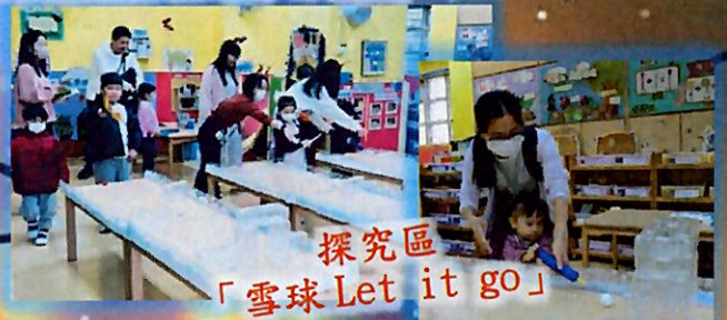
探究區 「雪球 Let it go」