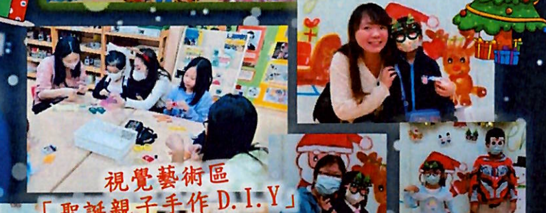
視覺藝術區 「聖誕親子手作 D.I.Y」