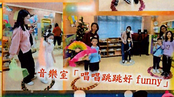
音樂室 「唱唱跳跳好 funny」