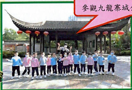
參觀九龍寨城公園真開心，Yeah！