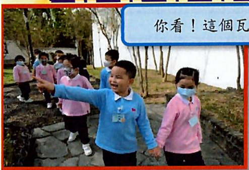
你看！這個瓦頂真漂亮！

為配合高班 11 月主題「建築物」，本校高班幼兒於 11 月 23 日到九龍寨城公園參觀，透過遊覽公園和寫生活動，讓幼兒了解九龍寨城的歷史，藉以增加幼兒對中國傳統建築設計的認識，也能培養幼兒學習欣賞中國園林之美。