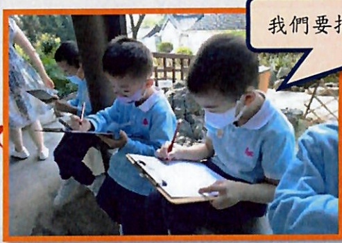
我們要把剛剛見到的亭子畫下來。