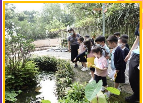
我們去戶外尋找昆蟲。