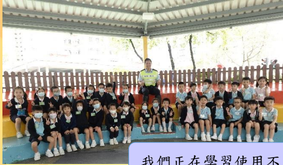
我們正在學習使用不同過路設施。

為配合主題「各行各業」，高班幼兒於4月22日參觀沙田交通安全城，透過交通警察為幼兒講解交通安全資訊，及幼兒扮演小司機在馬路上行駛，不僅豐富了幼兒對交通警察的認識，亦讓幼兒認識不同的道路安全設施及提高了使用道路的安全意識。