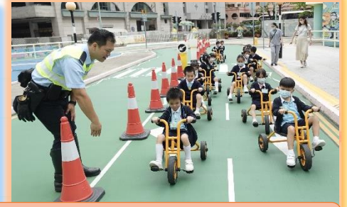
我們模擬小司機在馬路上駕駛。