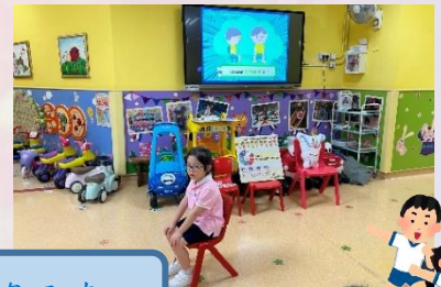
我們的站姿、坐姿正確。