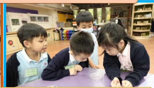
我們發現蟻蛛會模仿螞蟻的動作。