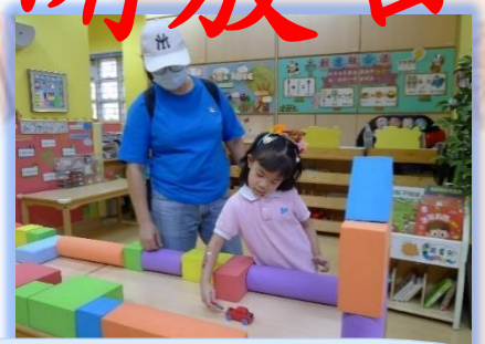
幼兒在探究區利用磁力相斥的特性推動車子前進。