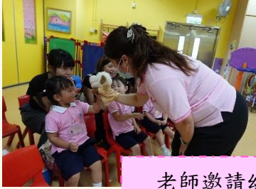
老師邀請幼兒一同打招呼。