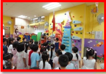
我們在進行升旗禮，升旗時要記得保持肅立。