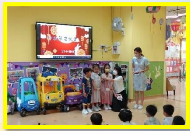
我們在進行節日廣播，認識中秋節的應節食物和活動。