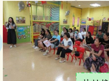
林姑娘與家長分享如何正面回應幼兒的情緒的方法。

本園於9月20日舉辦正向家長講座，是次講座主要由駐校社工林姑娘分享家長如何正面回應幼兒的情緒，並在日常相處中引導孩子學習處理情緒，從小做好情緒教育。