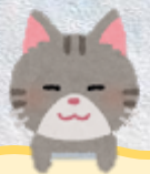
林老師 黃子淇 周連庭 歐楚瑜