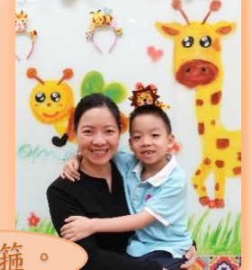
我們在視覺藝術區製作動物頭箍。