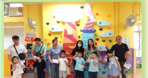
家長和小朋友在動感區合作收集彩球並運到波波池。