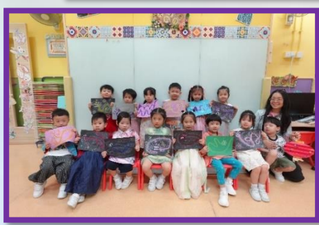
我們在玩花燈、猜燈謎和吃月餅，很開心啊!