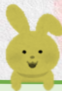
關尚霖 陳俊銜 江子琪 楊芷晴 黃楚妍 鄒海熠 鄧思妍