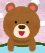
鄭相一 梁可澄 李政茵 譚胡柏 陳子晴