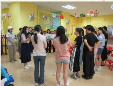
林姑娘正在帶領家長玩遊戲。