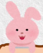
岑燁銘 鑾蔚琳 林槿寧 梁嘉淇 黃榛源