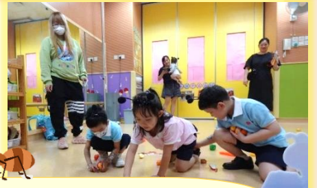
在音樂室，幼兒扮演「小螞蟻」並隨著音樂搜集食物。