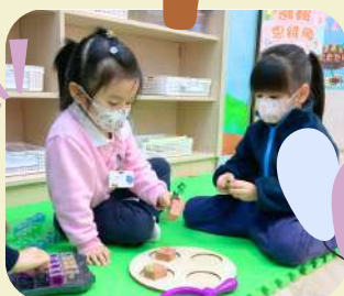
植物生長過程知多少