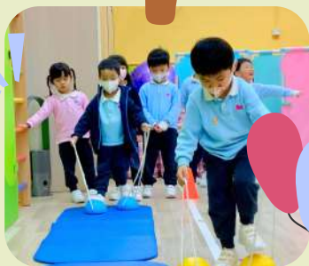
睇下我地邊個快啲!