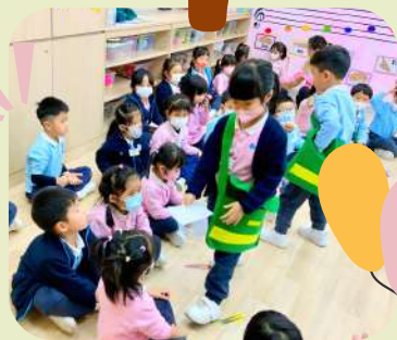
唔該郵差姊姊和叔叔!