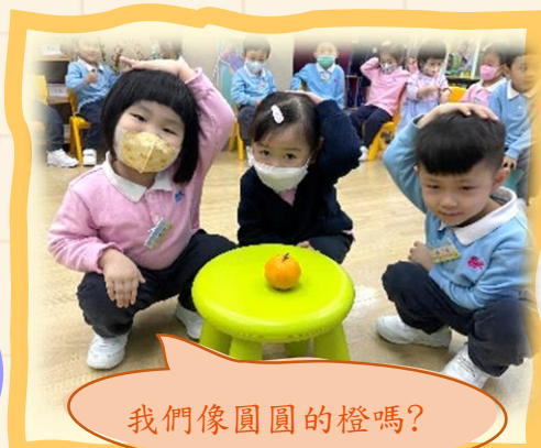
我們像圓圓的橙嗎？