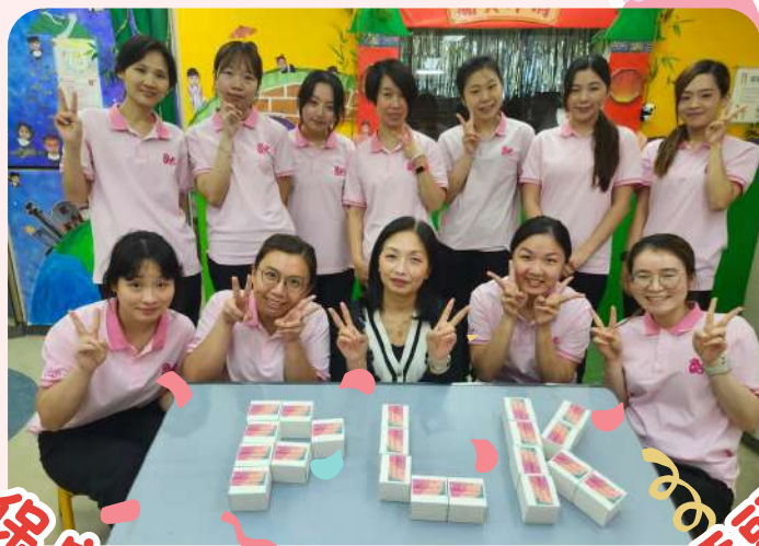
保良局董事會送贈旅行插頭

為讓員工在工作中輕鬆一下，保良局董事會向每名員工贈予旅行插頭及每人$50，以購買美味和健康的糖水，以表示對員工的謝意和關愛。