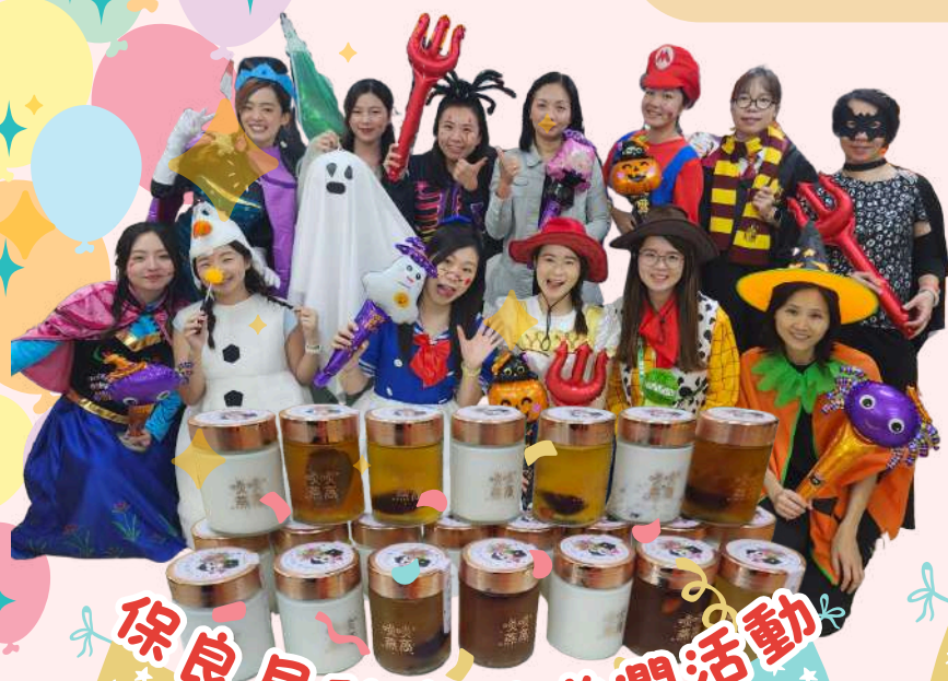
保良局秋燥送滋潤活動