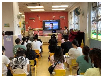
家長們十分專注地聆聽