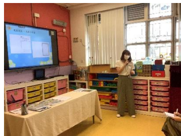
老師介紹校本功課