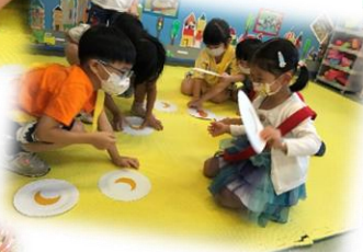
我們合力將圖片反轉先！