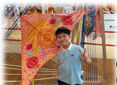
這個風箏是我畫的！