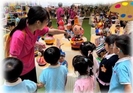
哇，這個葫蘆娃娃好靚呀。