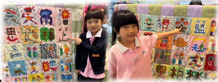
我們在百家被上找到自己名字了！