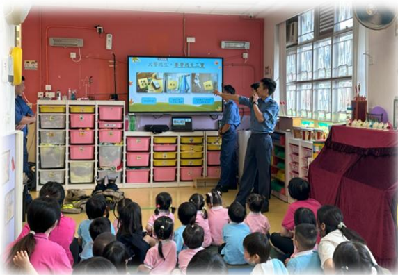
原來逃生三寶是鎖匙、濕毛巾及電話。