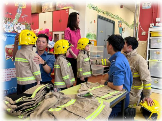
謝謝消防員哥哥幫我們換消防制服。