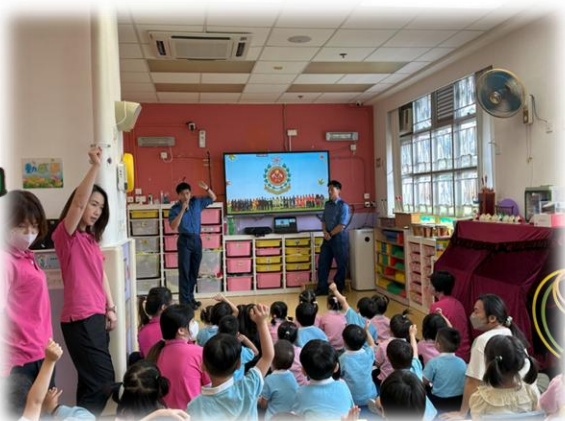
我們都好專心地聽消防員分享。