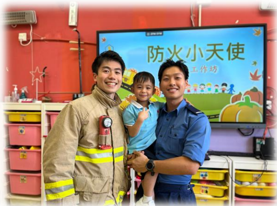
我長大之後都要像消防員一樣勇敢！