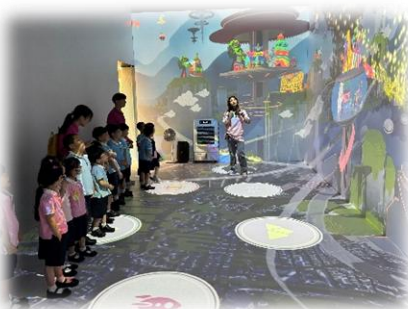
我們畫的圖畫在螢幕上出現了！