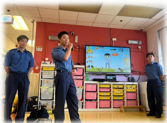
消防員裝備原來是這樣的。

本校邀請消防員到校舉辦講座，透過故事和遊戲形式，讓幼兒認識消防安全的重要性；並體驗消防員工作及裝備。