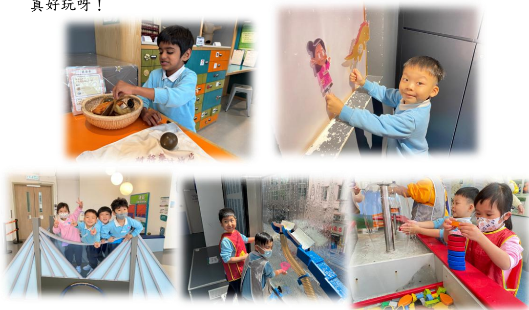
和大家一起来探索真開心！