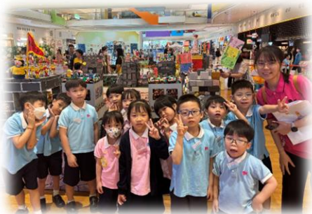
我們來到藝術展了！

本年度藝術展以「童繪華彩・童創未來」為主題，將「家」、「國」及「未來」的概念貫穿整個畫展，幼兒透過不同元素的作品展現出對中華文化的熱愛，傳遞愛與希望的訊息。