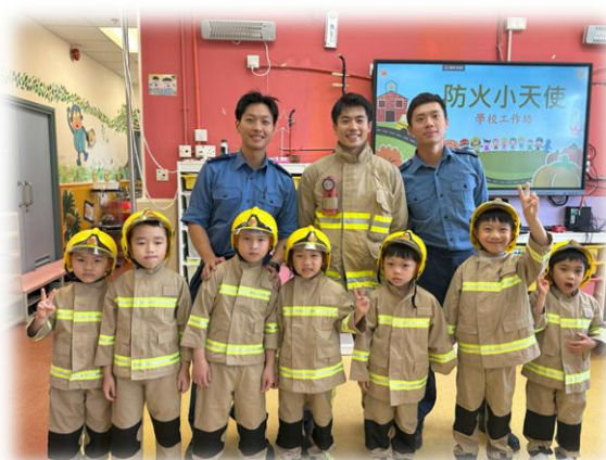
可以穿上消防員的制服好開心呀！