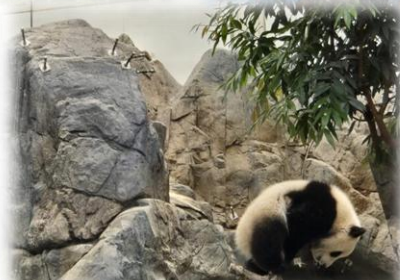
看！大熊貓在翻筋斗呢，好可愛！