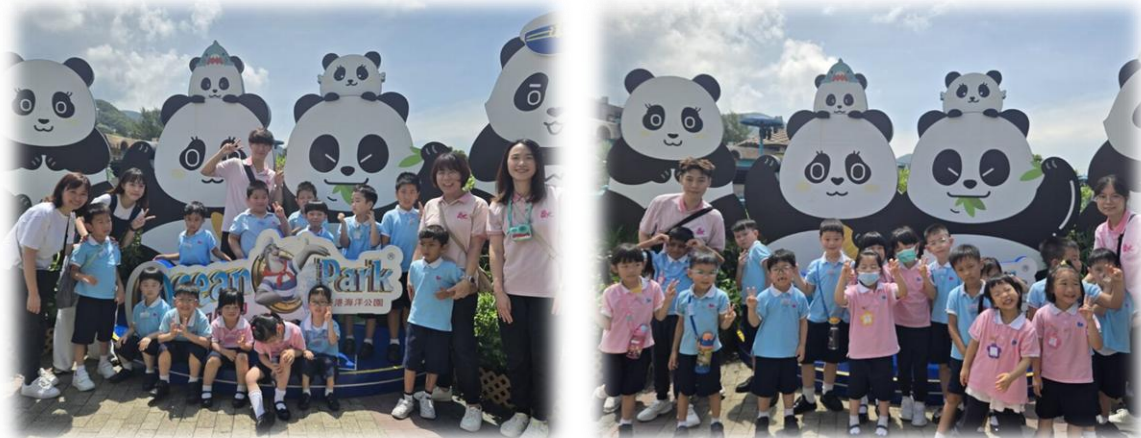
終於來到海洋公園了，先拍張大合照，好期待接下來的行程呀！

本次活動帶領低班及高班幼兒前往海洋公園，透過實地觀察與探索，讓兒童認識大熊貓的居住環境、四川動物的身體特徵與棲息地關係，培養愛護動物的態度。