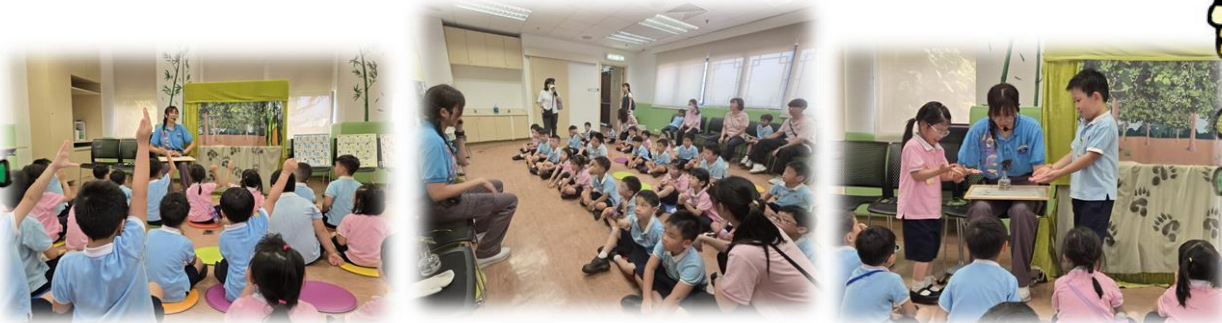
保育員姐姐為我們講解大熊貓、小熊貓和金絲猴的外形特徵和居住環境，大家都聽得很認真。